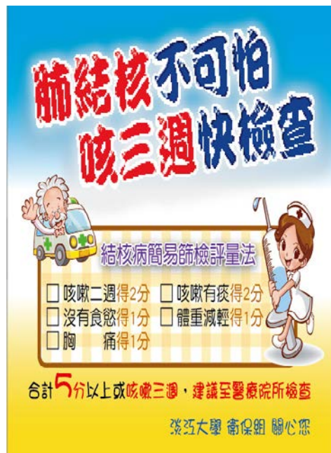
結核病七分篩檢法